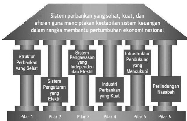
Gambar 1: Arsitektur Perbankan Indonesia

Kerahasiaan dalam perbankan sangat penting guna memberikan rasa aman bagi nasabah atau pengguna perbankan. Kerahasiaan perbankan diatur oleh Undang-Undang Perbankan. Meskipun bank diwajibkan menjaga kerahasiaan tetapi pada saat tertentu bank juga wajib memberikan informasi kepada pihak lain apabila ada pelanggaran yang dilakukan oleh nasabah atau pengguna perbankan. Arsitektur Perbankan Indonesia (API) adalah kerangka sistem perbankan di Indonesia yang akan memberikan arah, bentuk, dan tatanan industri perbankan secara menyeluruh dengan rentang waktu lima sampai dengan sepuluh tahun yang akan datang. Kebijakan yang digunakan oleh API diarahkan untuk pengembangan industri perbankan di Indonesia. Arah kebijakan tersebut dilandasi oleh visi yaitu untuk mencapai suatu sistem perbankan yang sehat, kuat dan efisien guna. Arah kebijakan tersebut juga guna menciptakan kestabilan sistem keuangan dalam rangka mendorong pertumbuhan ekonomi nasional yang baik dan merata.